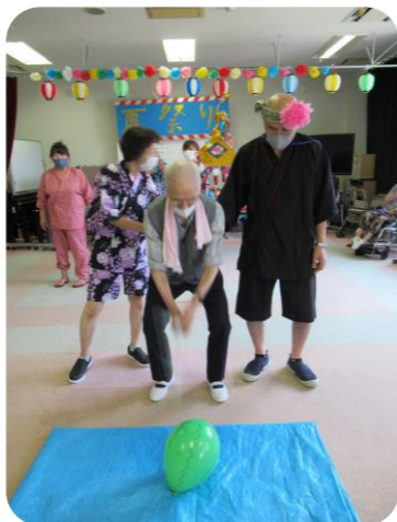
風船割りをする利用者

最後に美味しいおやつを食べ、お菓子のお土産を頂き「来年はコロナが終息して、盛大に夏まつりをできるといいですね」と話し、幕を閉じました。