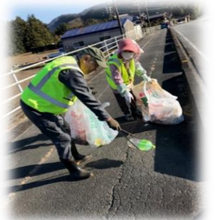
缶拾いをするボランティア