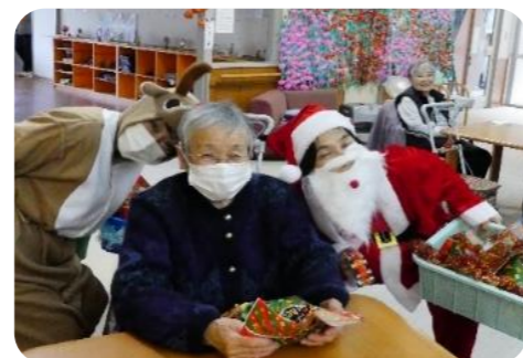
一緒にハイチーズ☆