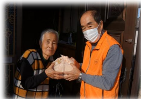
おせち料理を届ける民生委員