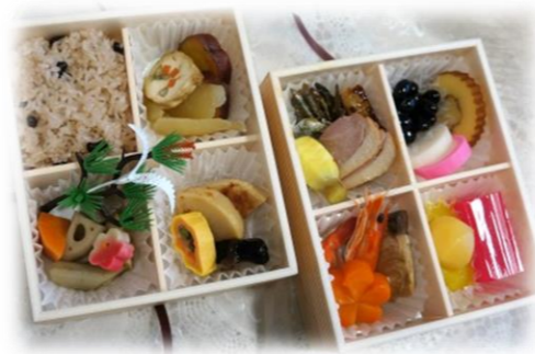
届けられたおせち料理

その他の一般募金は、令和3年度の地域福祉の充実などに役立てられます。ありがとうございました。