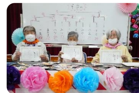
賞状を持ってハイチーズ!

次にグルメ点取りゲームを楽しみました。このゲームはトーナメント戦で競いました。惜しくも一回戦で敗退された方もいましたが、順調に勝ち進めその日の勝者を決めました。優勝・準優勝・3位の方にはステージ前に並んで頂き表彰式にて賞状を送り記念撮影をしました。他の方には「頑張ったで賞」を送りました。「こんな年になってからこんな賞状をもらえるとは思っていなかった」「額縁の方が高いやろけど飾らないかんわ」と楽しいひと時を過ごしました。