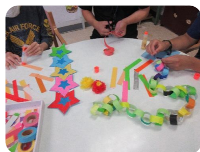
飾りを作る利用者

には「公園でブランコに乗りたい」「お母さんと早くディズニーシーに行けますように」などそれぞれの願いを込めた短冊を笹に結びました。コロナ禍でできる事も限られますが、利用者の方が楽しんで頂けるように職員一同頑張っています。