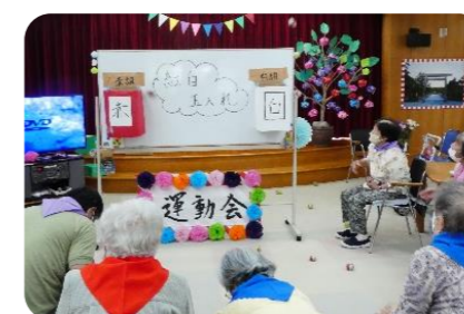
玉入れを楽しむ利用者