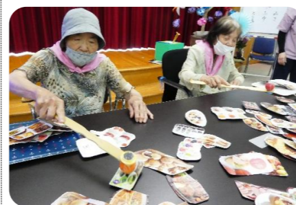
カードをたくさん取る利用者

笑いを誘っていました。新聞紙で作った軽いボールを使用したため皆さんの命中で必ず悪戦苦闘してみました。