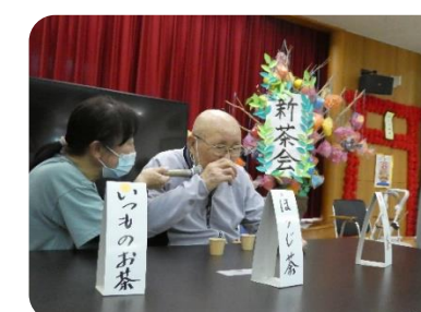
新茶を飲み比べる利用者