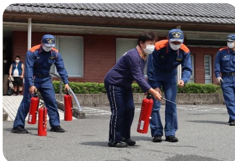
消火訓練を体験する職員