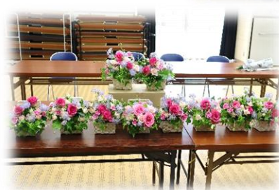
出来上がった作品