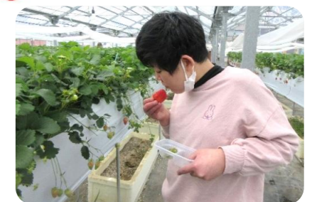
イチゴを堪能される利用者さん